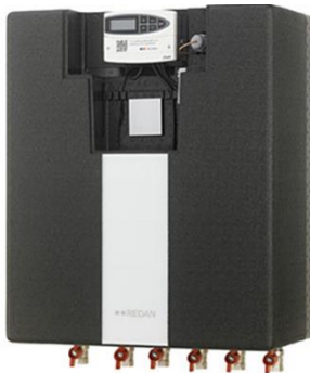
Danfoss Redan fjernvarme unit